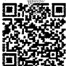
Qr-code app Android